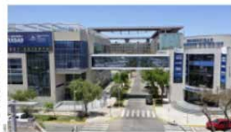
Profesionales con conocimientos actualizados con los que egresan de la UBO.