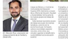
El primer año de la Universidad Bernardo O'Higgins (UBO)...